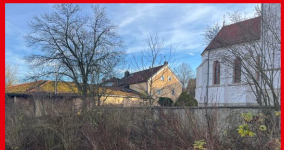
Bräu & Co. – Viele Baustellen in der Gemeinde

Wir stehen für Ehrlichkeit, Kompetenz und sozialen Ausgleich.