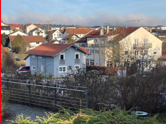
Blick auf Neukirchen ...

Wir erlebten ein politisches und administratives Versagen von Verwaltung und CSU/FW. Die Schließung der Schule in Dommelstadl ist Ergebnis eines jahrelangen Fehlmanagements. Die Verantwortung tragen die Mehrheitsparteien im Gemeindepapament. Ein einstimmiger Beschluss am 20. März 2018 zur Sanierung beider Schulen (ca. 1 Mio. Euro) wurde nicht umgesetzt. Verwaltungsversagen!