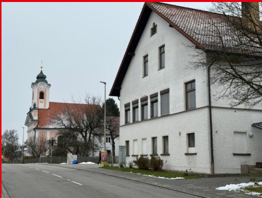
Schule und Kirche im Herzen Dommelstadls

Nichts prägt eine Gemeinde mehr als ihre Schule. Leider Fakt: Laut des Dr.-Tekles-Gutachtens betragen die Schüler-Eingangszahlen für Neukirchen nur 30 Schüler und für Dommelstadl nur 15 Schüler.