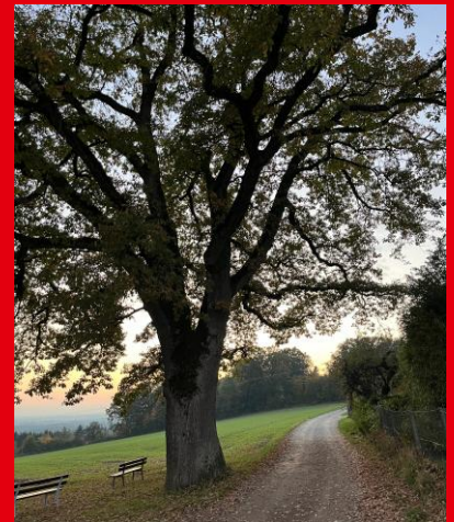
Passt zusammen: Idyllische Gemeinde & soziale Politik