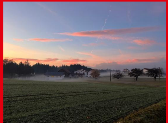
... und Dommelstadl