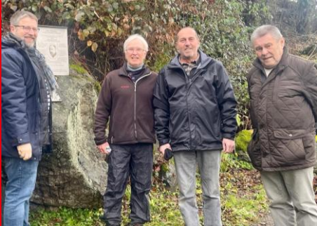
Am Auerfelsen am Marienstein

Die Bayerische Verfassung wird 80 Jahre und trägt eine klare sozialdemokratische Handschrift: