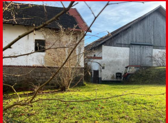
Pell: Standort der künftigen Gemeindeschule